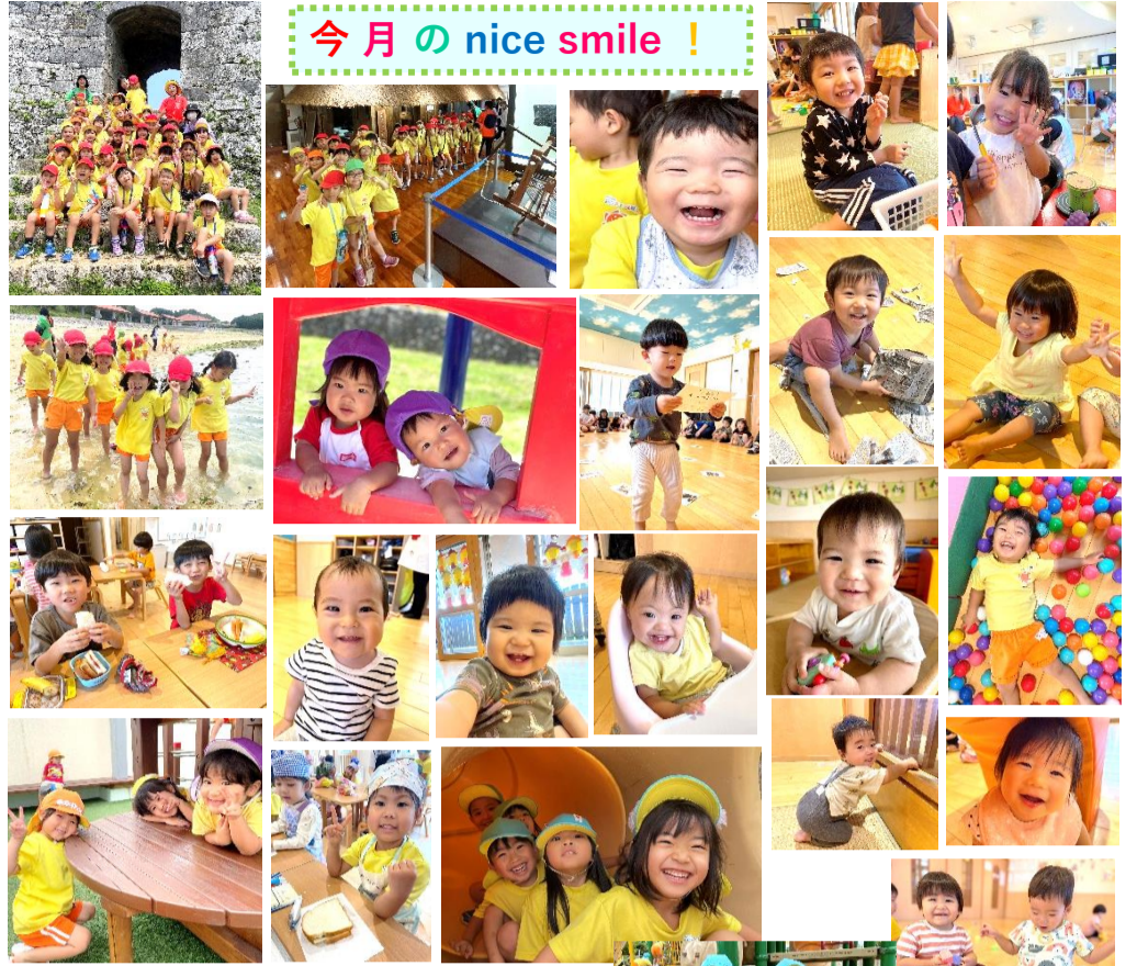
今月の nice smile !

雨の季節がやってきました。子どもたちはお気に入りのレインコートや長靴をうれしそうに披露してくれます。梅雨の季節は湿度・温度ともに高くなりますので、熱中症、感染症が流行する時期です。体調管理に気をつけながら今月も元気に過ごしましょう。先月は個人面談へのご参加ありがとうございました。家庭での様子などお聞きする事ができ、また園へのご要望などもお話しできる良い機会となりました。個人面談でのご要望などは、その都度改善しながらお知らせしていきたいと思っておりますので、今後とも宜しくお願いします。