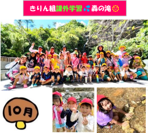
きりん組 課外学習 森の滝

先月はアデノウイルスや溶連菌等の感染症が流行しています。子どもたちの体調管理に十分気を配り、今月も元気に過ごしていきましょう。