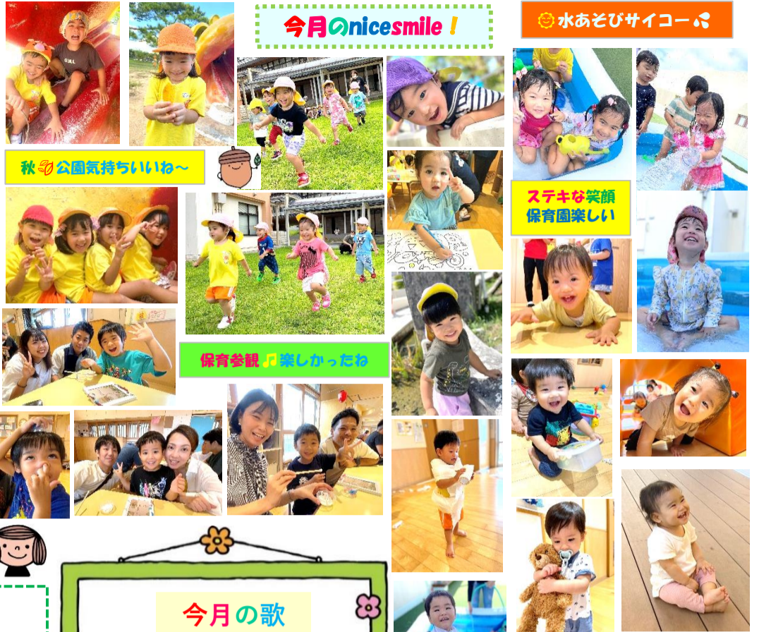
秋の公園気持ちいい～