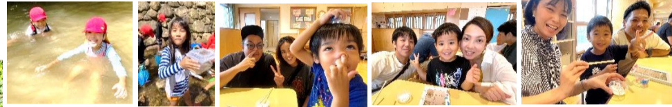
保育参観 楽しかったお