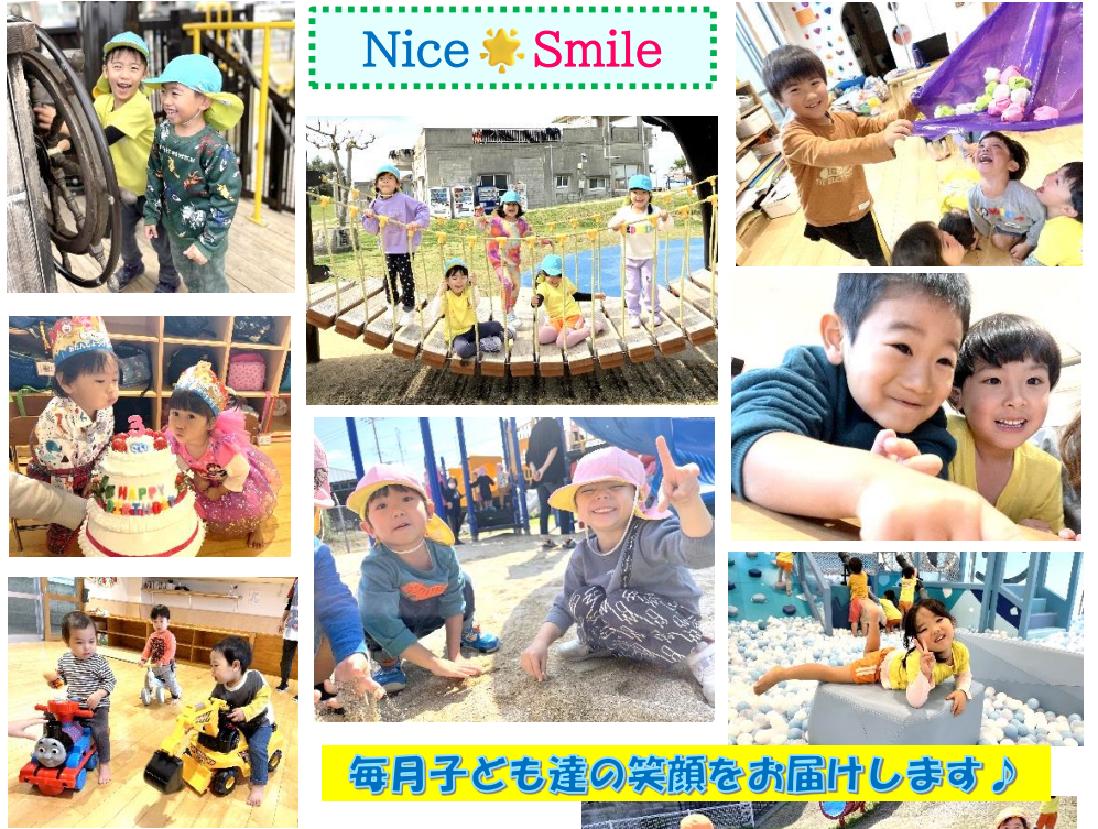
毎月子ども達の笑顔をお届けします♪